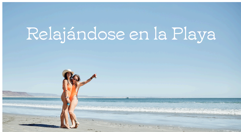
Relajándose en la Playa